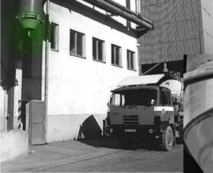
CONTROLLI DI LIVELLO CON I KAS-7035SM32-100°C