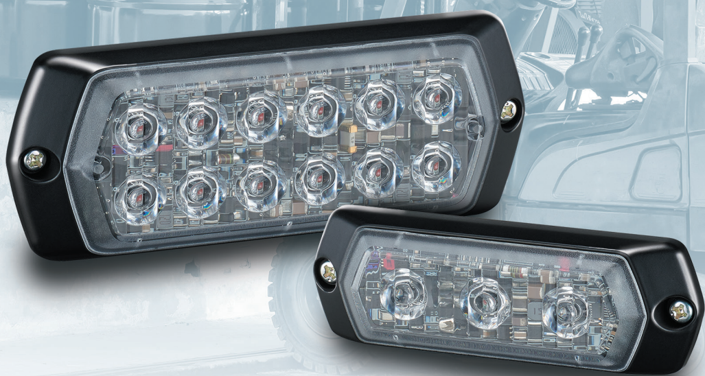
Tipo di colore luminoso